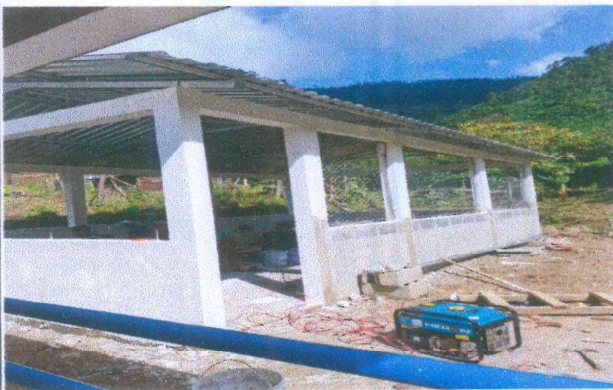
Foto 3: Mejoramiento de losa (tipo torta) e instalación de piso cerámico